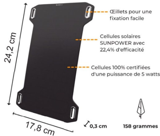
Figure 1. Panneau photovoltaïque

De nouveaux fabricants développent des solutions solaires portables pour répondre à la demande croissante de recharge de téléphone mobile. Le panneau photovoltaïque (figure 1) en est une illustration. Il s'agit d'un panneau solaire en silicium monocristallin réputé pour son rendement (ou efficacité) élevé, soit 22,4 % annoncé par le constructeur et défini dans des conditions normées d'éclairage.